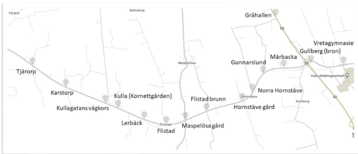
Bild: Hållplatser i området.