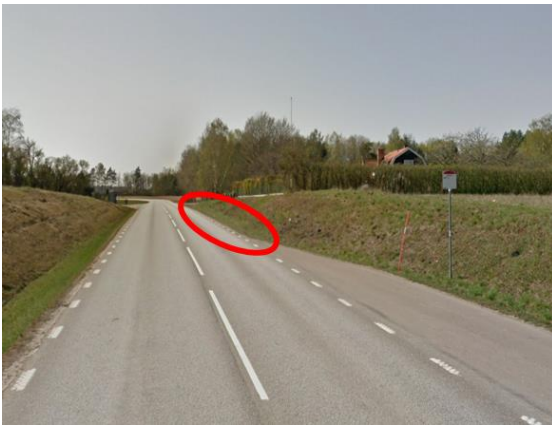
Bild: Hållplatsen vid Mårbacka.

Ett antal hållplatser upplevs som felplacerade eftersom det är farligt att ta sig till och från hållplatsen. Vägrenen att gå på är minimal eller obefintlig och inte sällan går man med biltrafiken i ryggen. Bilar som kör om behöver gå ut i andra körfältet vilket kan skapa farliga möten och omkörningar.