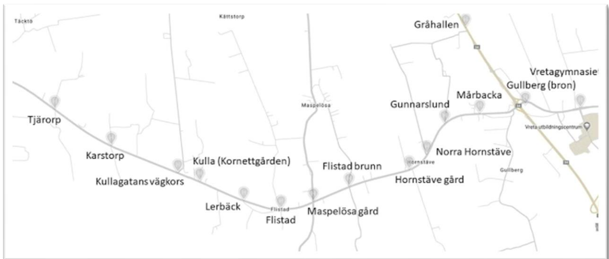
Bild: Hållplatser i området.