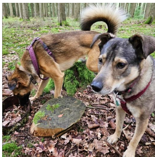
På spaning efter en hundrastgård.

Har någon förslag på plats eller är villig att upplåta en bit mark för ändamålet få du gärna höra av dig.